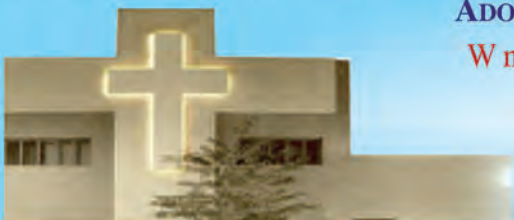
Jezuicki Ośrodek Milenijny

W pierwszy piątek miesiąca - od 17:30 do 19:30